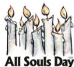
All Souls Day

All Souls Mass envelopes are in the back of the church. All names received will be included in our novena of masses beginning on All Souls Day, November 2, 2018.